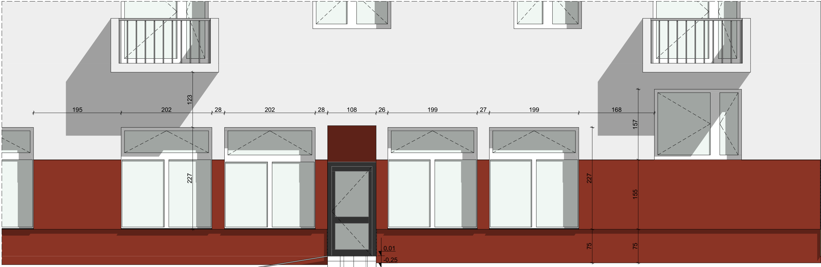
Elewacja północna - frontowa